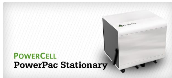
Powercells stationära hjälpkraftsaggregat

Powercell är baserat i Göteborg och har efter över 15 års forskning och utveckling lyckats få fram ett unikt bränslecellssystem med en sk reformer. Resultatet av ansträngningarna är ett mycket effektivt system där reformer delen omvandlar diesel och andra former av bränsle till vätgas som i sin tur via bränslecellsstacken omvandlas till el i en så gott som optimal, utsläppsfri och tyst process.