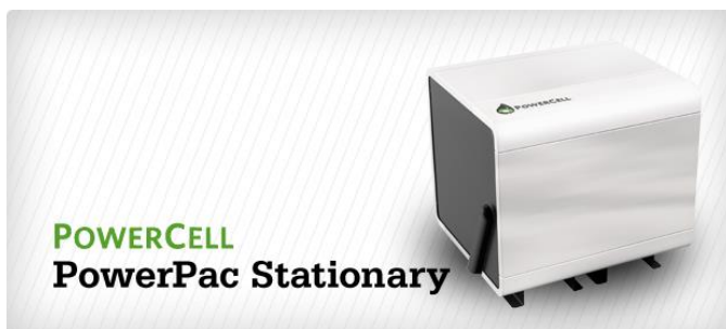
Powercells stationära hjälpkraftsaggregat

Fouriertransform och Volvo Group Venture Capital tilldelades i april Svenska Riskkapitalföreningens pris för "Årets mest samhällsnyttiga investering 2013" för sin investering i Powercell. Powercell är baserat i Göteborg och har efter över 15 års forskning och utveckling lyckats få fram ett unikt bränslecellssystem med en s.k. reformer. Resultatet av ansträngningarna är ett mycket effektivt system där reformerdelen omvandlar diesel och andra former av bränsle till vätgas som i sin tur via bränslecellsstacken omvandlas till el i en så gott som optimal, utsläppsfri och tyst process.